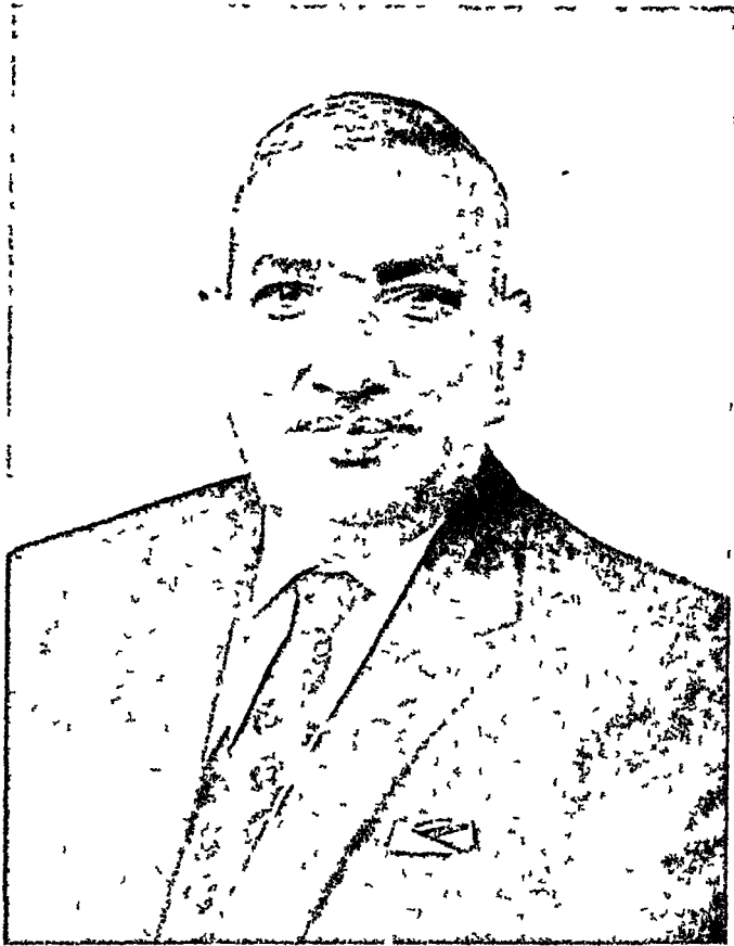
श्रीमान् माननीय साहू शान्तिप्रसादजी जैन