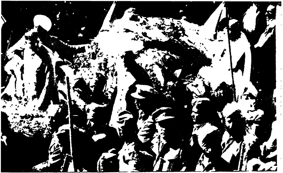
बापू की अर्थी का जलूस