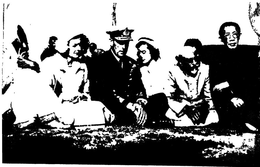
बापू की दाह-क्रिया के समय लार्ड और लेडी माउंटबेटन अन्य नेताओं के साथ